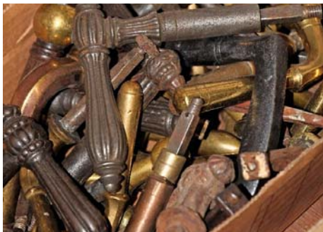
/ „Wenn wir einen Artikel nicht in alt haben, können wir die Reproduktion anbieten.“