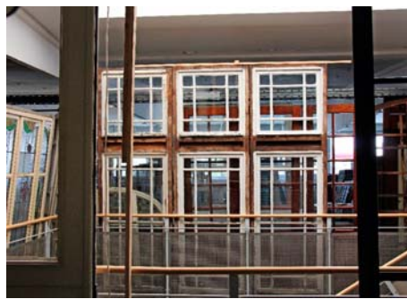
/ Fenster oder Türen werden bei Bedarf von Schreincrn dem aktuellen Stand der Technik angepasst.