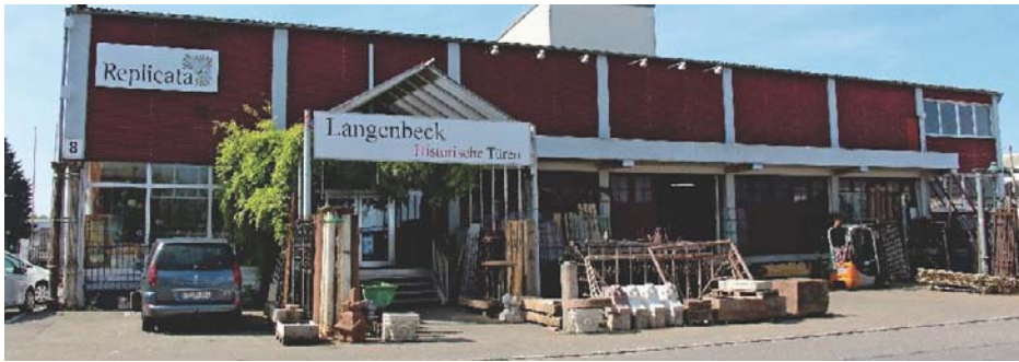
In Langenbecks Ausstellung im Freiburger Westen findet sich auf 4000 m 2 alles an historischen Baustoffen, was ein Sammlerherz höherschlagen lässt.