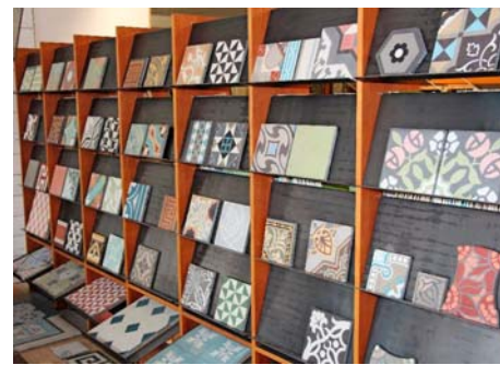
/ Soll es eine alte Fliese mit Patina sein oder lieber die reproduzierte Fliese in alter Form?