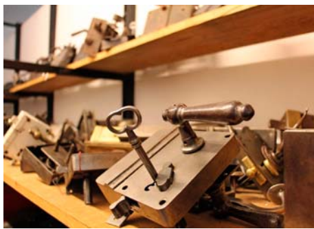
/ Die Nachfrage nach historischen Baustoffen ist groß – auch für Neubauten.