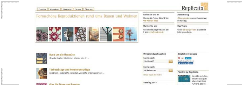
Drei Firmen unter einem Dach: Unter www.replicata.de gibt es Replikat, welche die historischen Originale der beiden anderen Sammlungen ( www.historische-tueren.de , www.historische-kleinteile.de ) ergänzen.