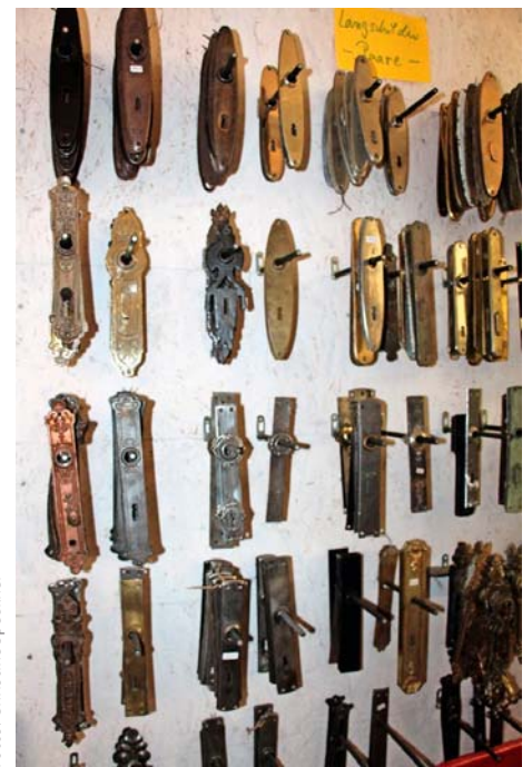
/ Kleinteile können Kunden ausschließlich über einen Onlineshop beziehen.

■ Es gibt Kunden, die sagen frei raus: „Wir sind Langenbeck-verseucht.“ Und das im positiven Sinne. Was damit gemeint ist, versteht, wer die Ausstellung im Freiburger Westen besucht. Auf 4000 m 2 findet sich alles, was ein Sammlerherz höherschlagen und einen zweiten oder dritten Besuch sehr wahrscheinlich werden lässt: Neben historischen Türen aus verschiedenen Stilepochen reihen sich Eisenzäune, alte Fenster, gusseiserne Heizkörper, Haustürklinken, Möbelbeschläge und seltene Einzelstücke wie ein Arztmöbel aus dem 19. Jahrhundert. An meterlangen Wänden hängen alte Türklinken, Beschläge aus vergangenen Zeiten, wie Fitschenbänder – und ja, auch Fliesen in den verschiedensten Größen, Farben und Dekoren. Die Aufzählung ist noch nicht zu Ende – da wird man unterbrochen, vom Firmenchef persönlich. Florian Langenbeck, 56, steht da und fragt: „Wollen Sie noch mehr sehen?“ Sein Blick ist vielsagend. Also steigt man neugierig in einen Lastenaufzug – logisch, ein Muss in diesem Laden – und fährt mit ihm eine und zwei Etagen tiefer. Dort befindet sich ein einmaliges Refugium an historischen Baustoffen,