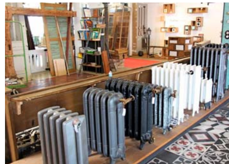
/ Langenbeck sammelt alles, was bei einem Hausabriss anfällt. Selbst Heizkörper gehören dazu.

beck heute. Beide Firmen haben ein klares, unverwechselbares Profil.