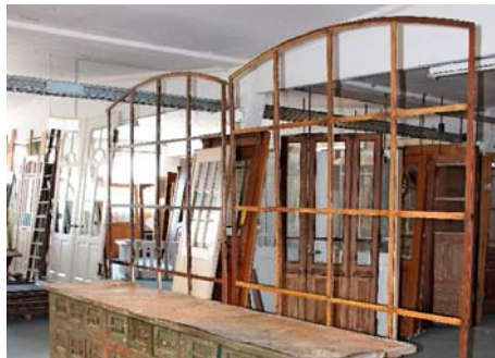
/ Früher schaufelte Florian Langenbeck auf Bauschuttdeponien eigenhändig die alten Schätze frei.